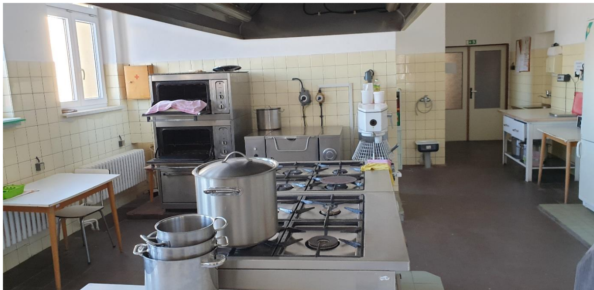
CELKOVÝ POHLED NA VARNÉ CENTRUM

Co se týče varného centra (odtahu/VZT) dojde k jejímu zabezpečení vůči poškození v rámci stavebních prací.